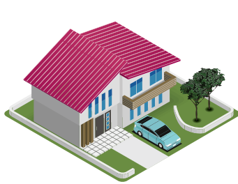
●個別供給(戸建て住宅)のお客様

※質量販売、工場など高圧ガス保安法上の消費者、国及び地方公共団体の管理する施設は、対象外です。