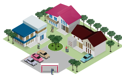
●コミュニティーガス団地のお客様